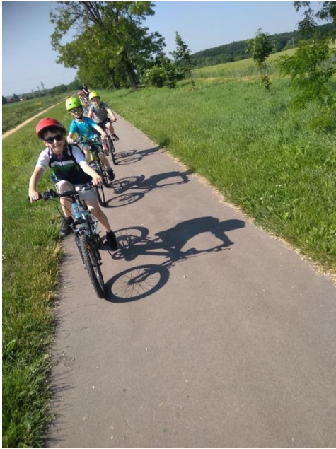
Biciklitúra a Desedára