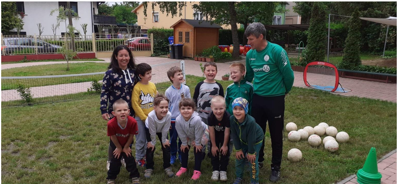
Dúsító program: Futball