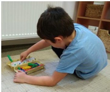
kiegészítő tevékenység: szín szerinti válogatás csipeszekkel