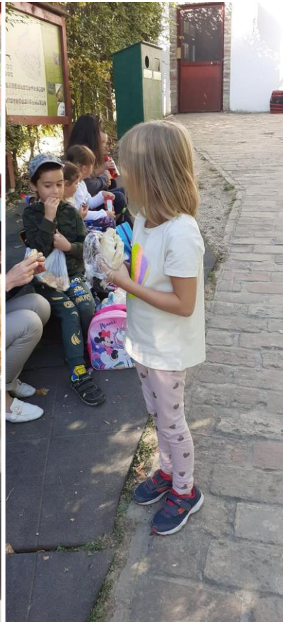
Jól esett a tízórai