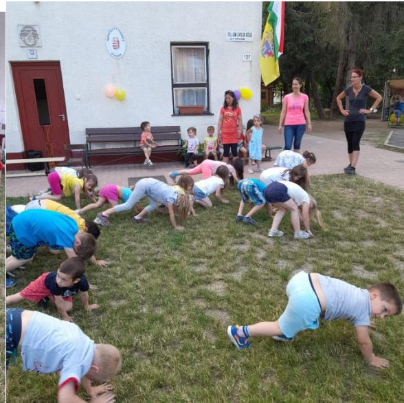
A mozgás alapjai: KSG és fitness játékok-mindenkit megmozgattunk