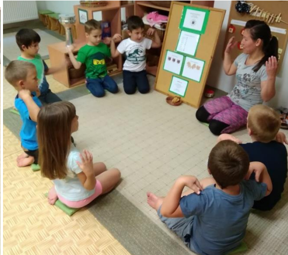
Bátorító mondóka megtanulása:

„Erős vagyok, szép vagyok, jó a szívem, jól vagyok, izgek, mozgok, jógázok, bátorsággal tornázok.”