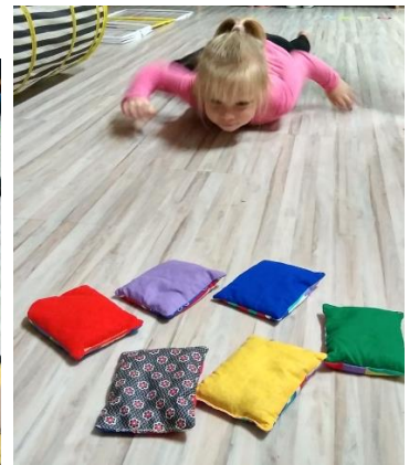
Állatok mozgásának utánzása