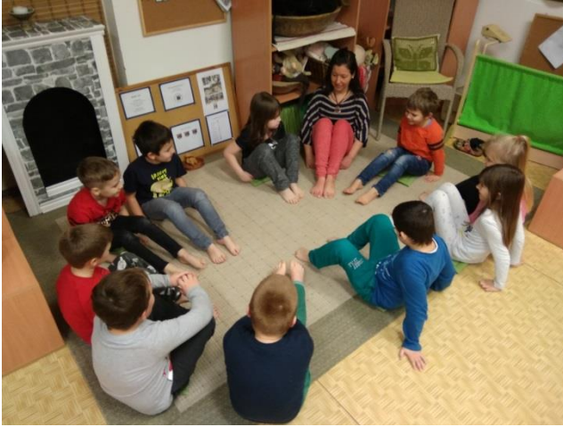
„Mászik a csigabiga”-lábboltozat ersítése