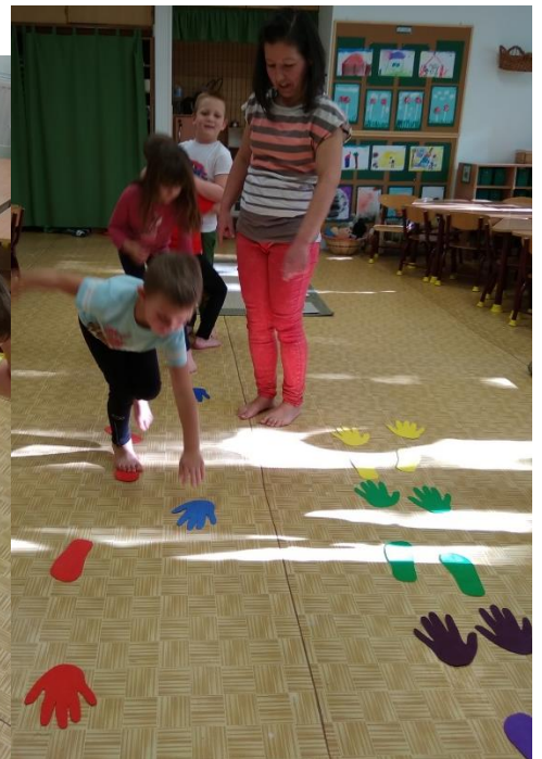
Saját készítésű mozgáskotta lapok különböző mozgásformákkal