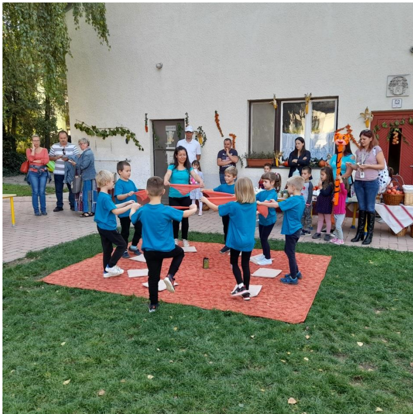
Továbbra is működik a Mozgáskuckó!