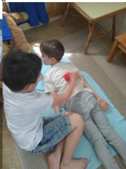
És végül a megérdemelt hátmasszázs