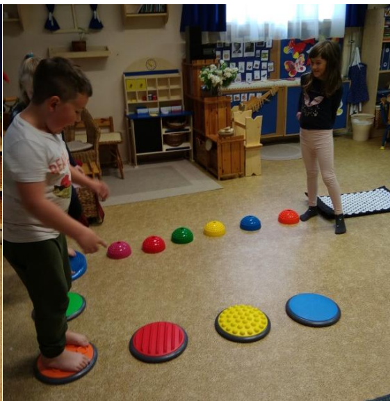
Úton a szigetre