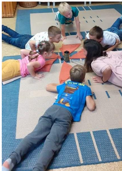
A Mihály napi vásárban bemutattuk jógás tornánkat és kendős táncunkat