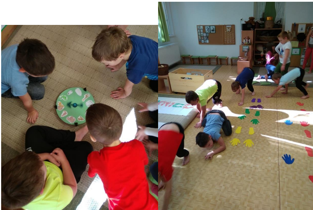
Amelyik állatot kipörgettük, annak a mozgását utánoztuk