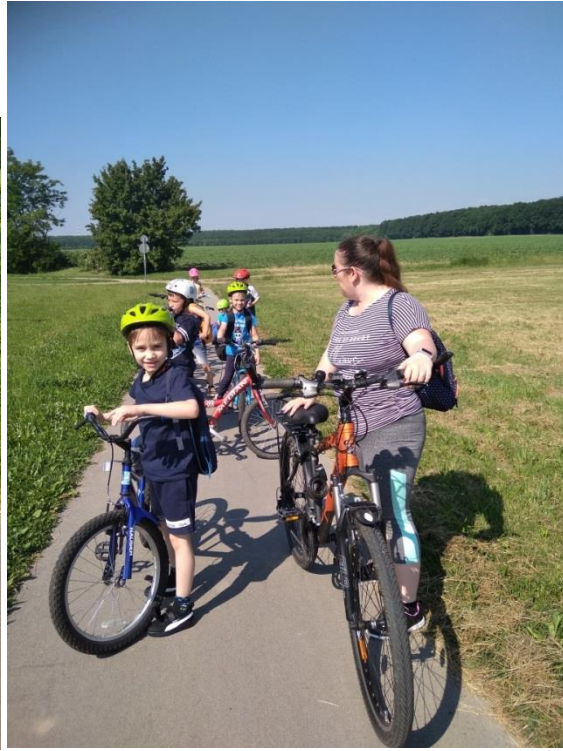
Katica Tanyára kirándultunk