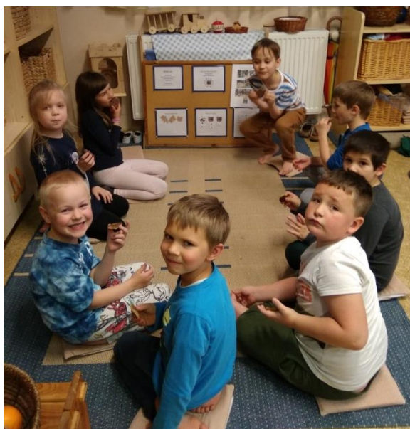
Minden foglalkozás végén volt finomság