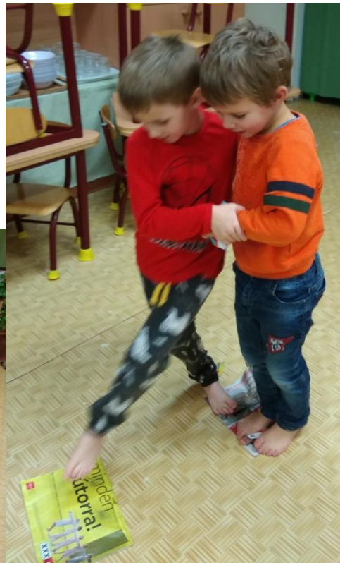
átkelés a „köveken”